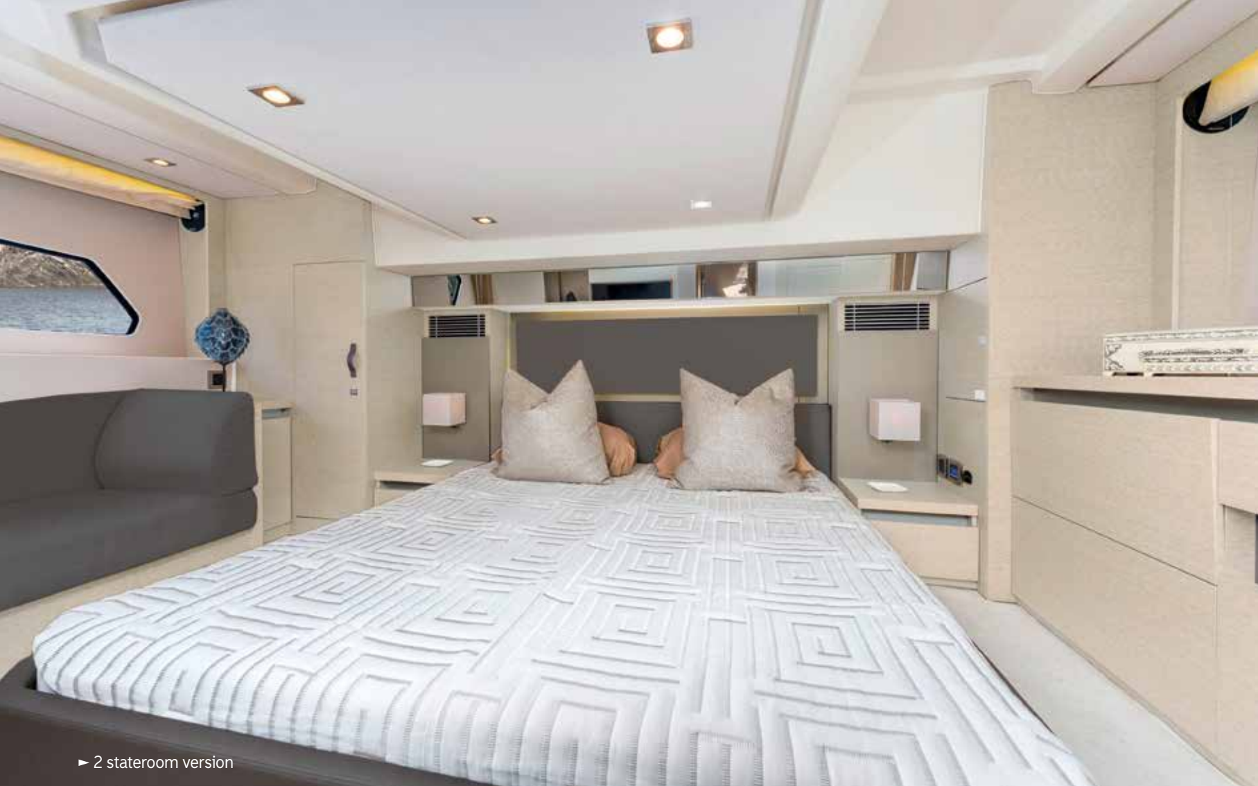
► 2 stateroom version